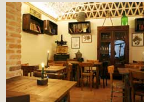
Cantinetta della CORTE

La sala convegni, accessibile sul lato di Piazzetta Salvoni, ha ingresso indipendente con guardaroba, 80 sedute in pelle e tavolo per relatori. Sia il Teatro che questa sala sono dotati di regia indipendente, schermo, proiettore e servizi. La Cantinetta della Corte, affacciata sulla stessa piazzetta, è un'enoteca-osteria che, collegata internamente con gli spazi di CORTE, può fornire servizi di ristorazione.