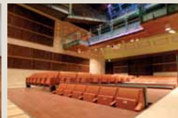
Sala Francesca da Rimini - Teatro