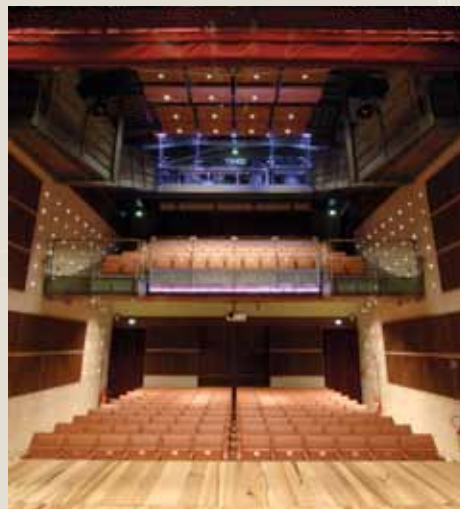
Sala Francesca da Rimini - Teatro

Il palazzo che ospita CORTE si articola in oltre 1.000 mq disposti su tre livelli; sito al centro di Coriano è facilmente raggiungibile dalla costa e dall'entroterra. La struttura è pensata come uno spazio integrato per la realizzazione di spettacoli, esposizioni, eventi, incontri e convegni. Il Teatro dispone di 120 posti in platea, con poltrone a scomparsa (brevetto Frau), e 69 in galleria. Il palcoscenico è modulabile in profondità a seconda delle esigenze. Collegati alla biglietteria il guardaroba e il foyer con struttura in acciaio e vetro con vista panoramica sul mare.